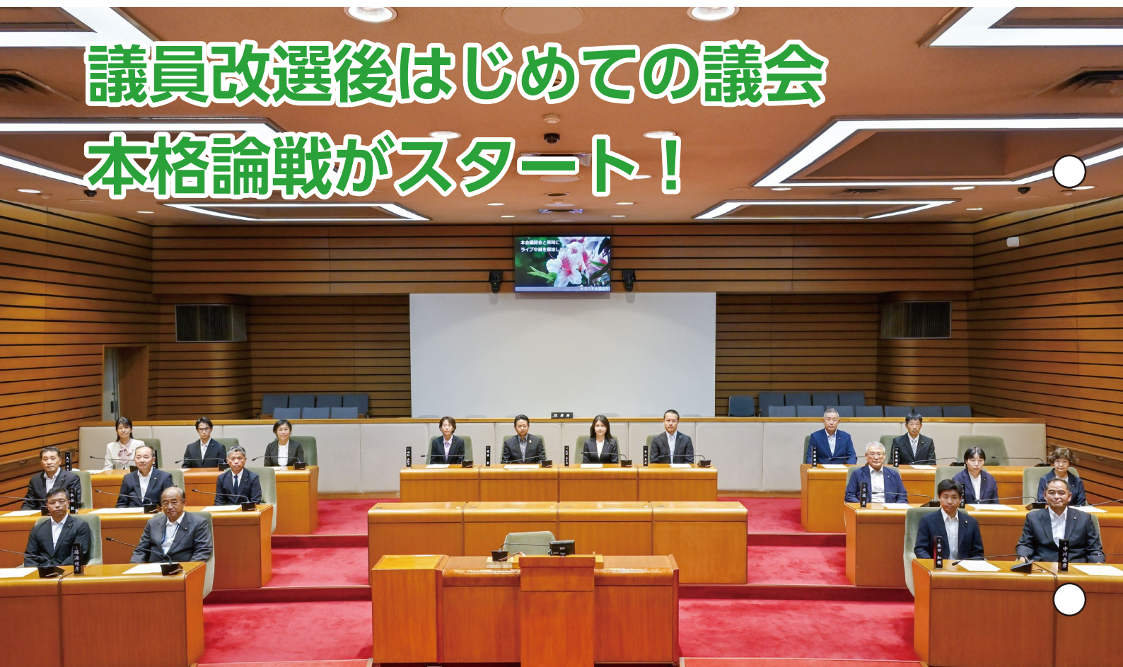
第3回定例会 本会議開会前の様子