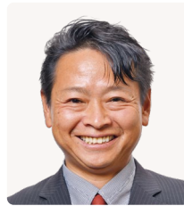
大阪維新の会 塚本 崇