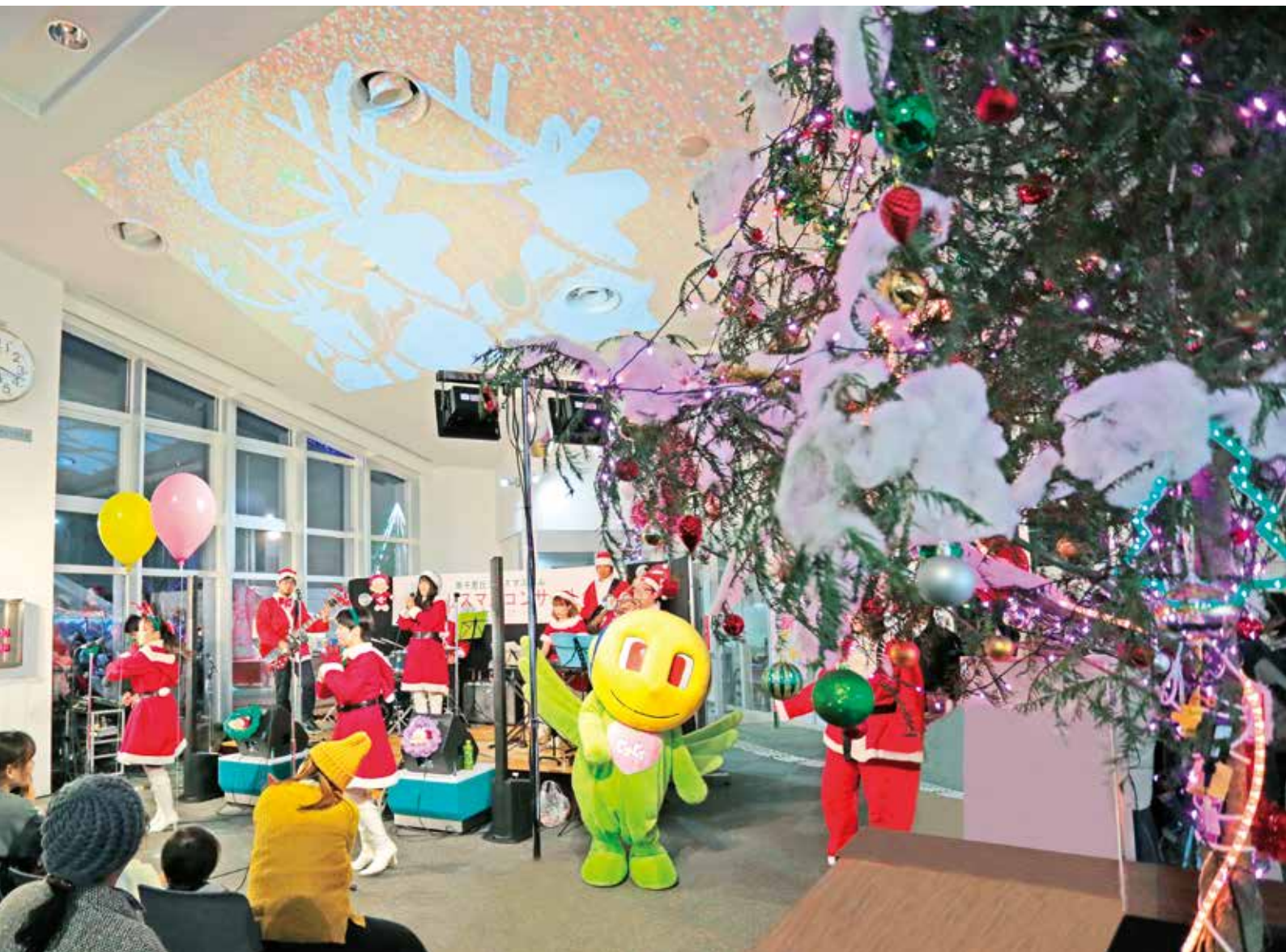
南千里丘クリスマスバルの様子