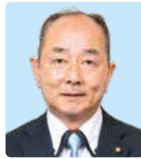
公明党 水谷 毅