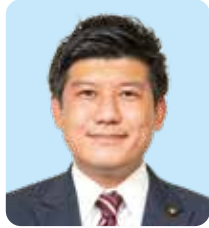
大阪維新の会 三好 俊範