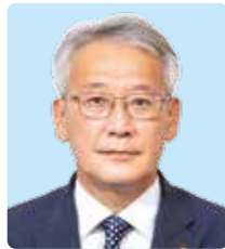
日本共産党 安藤 薫