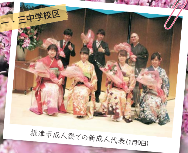
摂津市成人祭での新成人代表(1月9日)