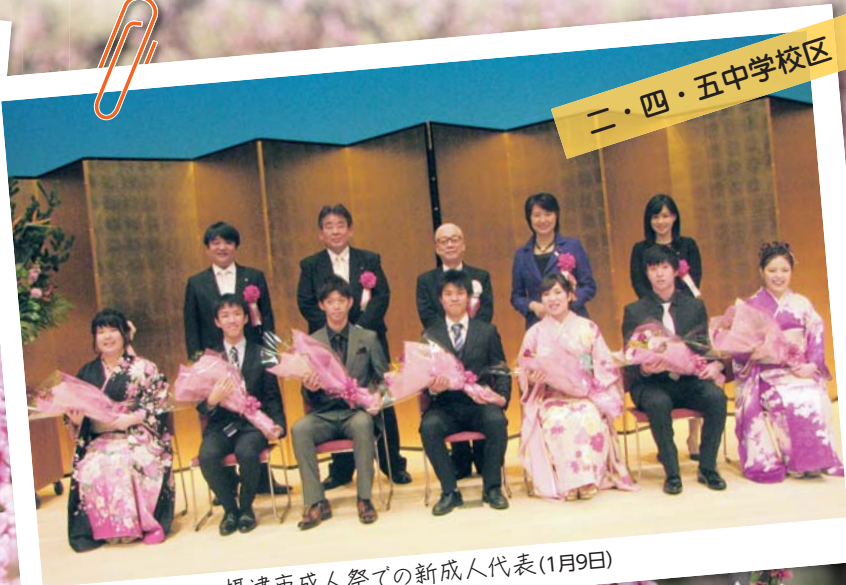
摂津市成人祭での新成人代表(1月9日)