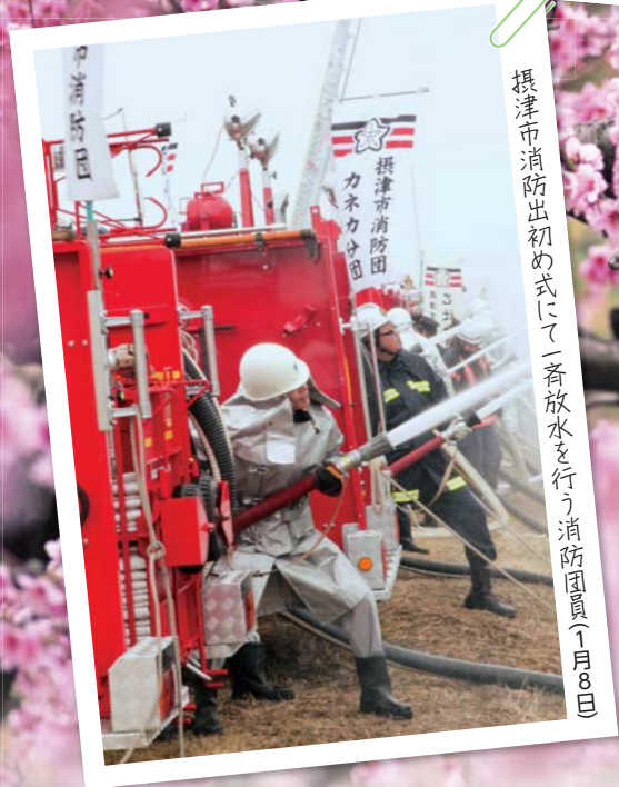
摂津市消防出初め式にて一斉放水を行う消防団員(1月8日)