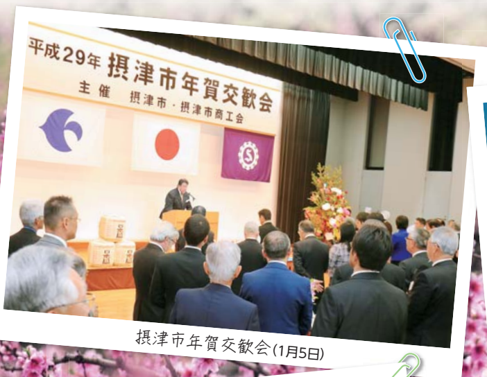
摂津市年賀交歓会(1月5日)