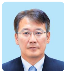
日本共産党 安藤 薫

ンターや文化ホール、千里丘公民館など新築、改築の際に合わせ設置しております。ご指摘のように民間施設での洋式トイレの普及率は9割以上であると同っており、既設の公共施設へのシャワー付きトイレの設置に向け計画的に取り組んでまいります。